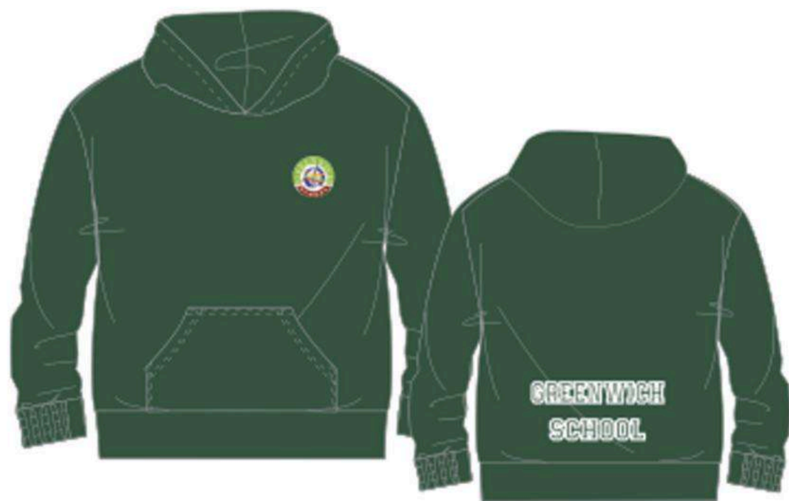
Sudadera de felpa

Prendas adicionales a partir de 1º de Primaria hasta 2º de bachillerato”